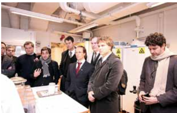
Figura 7 - Ouvindo explicações em visita ao Departamento de Biomateriais da Universidade de Gotemburgo.