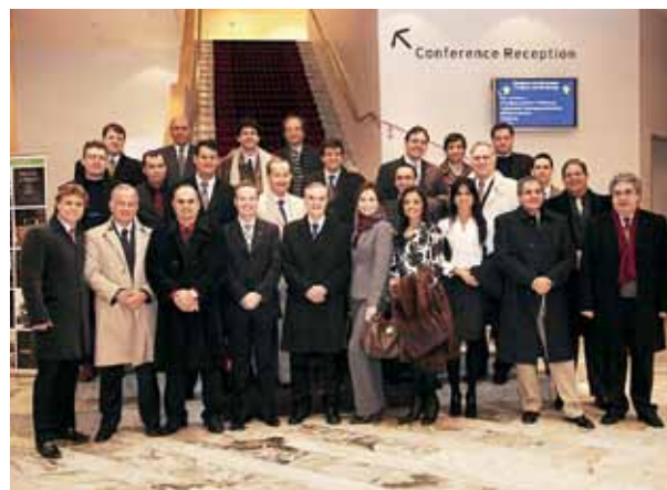
Figura 4 - Hotel Gothia Towers - Gotemburgo - Suécia (Grupo Brazilian Day II).